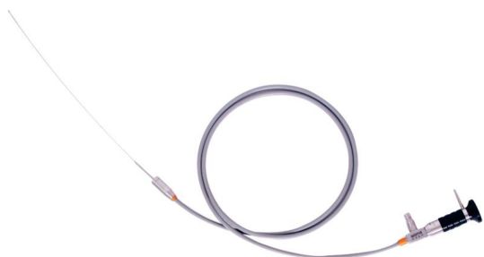
纤维物镜观察系统